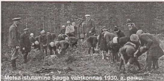
Metsa istutamine Sauga vahikonnas 1930. a. paiku.

Metskülast, mida erinevatel aega-del nimetatud erinevalt (Mieczi, Miesla, Meczkuia, Meylia, Mieczkilla, Das Dorff Metzla, Das Dorf Metzku ja Metzla) oli 1930. aastateks arenenud suur ja elujõuline küla. 1935. a. oli Viljandi Ajutise Maavalitsuse ja Metsküla Haridusseltsi andmetel küla pin-dala 2414,29 hektarit, majapidamisi 82, elanikke 365. Majapidamistest 32 olid vanatalud, 40 väiketalud, 10 käsi-töölise majapidamised. Vanatalude hulgas oli 2 Kulbi, Kurika, Lellepi, Raudsepa, Toosi ja Vidu talu, 3 Palit-set ja koguni 4 Soobat, üks teistest kaugemal.