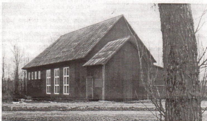
Metsküla rahvamaja. Otsa on ehitatud kinoputka.

Kool suleti 1968. a. 1. septembrist õpilaste vähesuse tõttu.