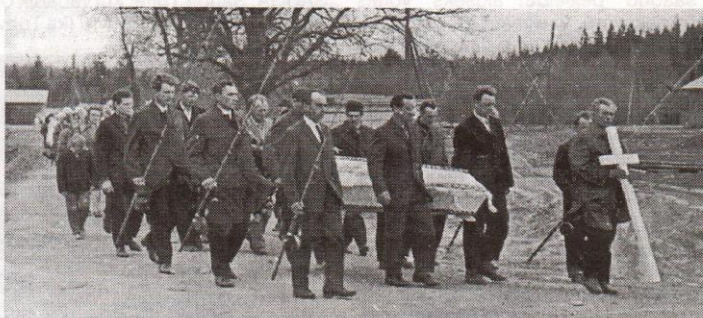
Viljandi Kalasport Klubi TOHVRI seksiooni liikmed saavad viimse teekonnale üht eneste hulgast. Foto 1970. a. paiku.