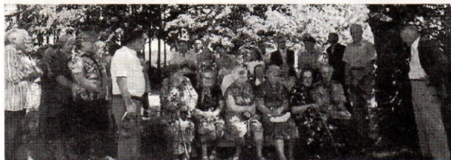
● Külapäevalisi Metsküla algkooli õuel 31. juulil 1999. aastal.

Minu endise kodumajakese taga metsanukas on nüüd kena lõkkeplats, kiik kääksub jälle, lõbustades noori ja vanu. Oli hirmsuur lõke, tujutõstev pillimees ja lõõdi tantsugi. Kui palju oli kohtumise- ja äratundmise rõõmu, kallistusi ja pisaraidki ning mitugi korda tuli küsida: „Ütle, kes sa (Järg 2. lk.)