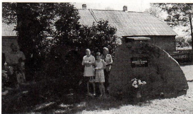
● Oma vanaisa luuletusi loevad külapäeval Kohvi pere noored.