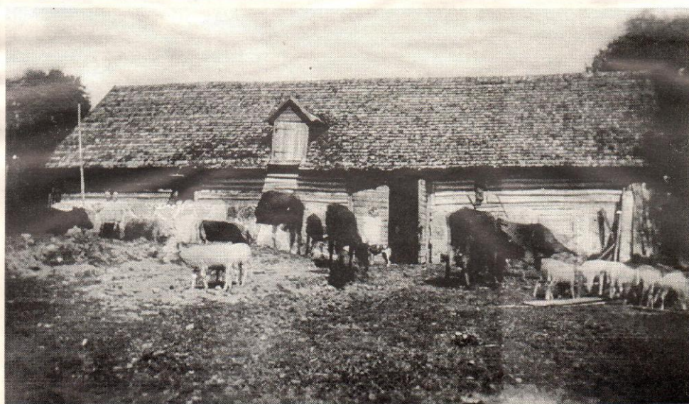
● Varesse talu karjalaut ja kari 1930. aastail.